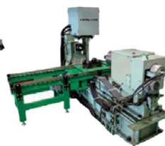
主電動機総合試験装置