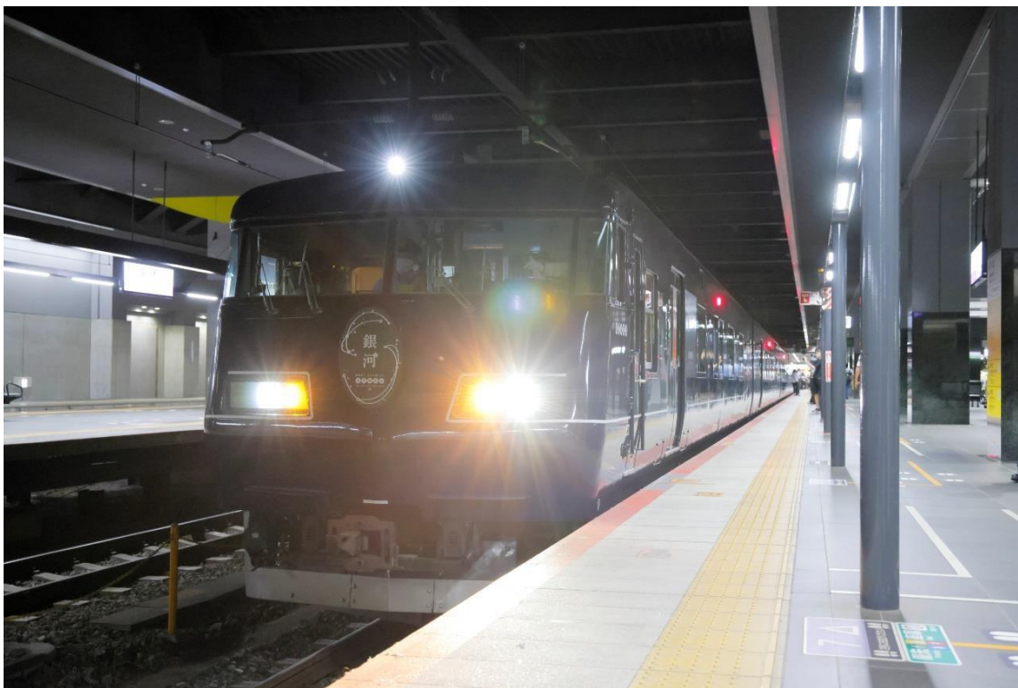
鉄道旅の楽しみがたくさん詰まった「WEST EXPRESS 銀河」

ときには長距離昼行特急、あるときには夜行列車とシーズンによって走行区間と時間帯を変える、「WEST EXPRESS 銀河」。往年の寝台特急を彷彿とさせるような設備や快適な個室、乗客がそれぞれのスタイルで自由な時間を過ごすことができるフリースペースといった個性豊かな車内、そして今となっては珍しくなった、長距離を走りぬく列車スタイルが人気を呼び、デビュー以来各コースともに満席が続いています。